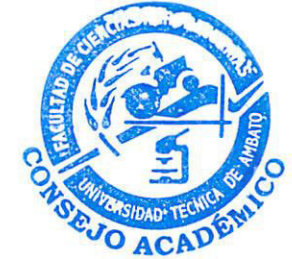
HORARIO DE TRABAJO DEL PERSONAL ACADEMICO