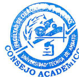
HORARIO DE TRABAJO DEL PERSONAL ACADEMICO