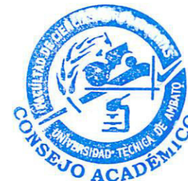
HORARIO DE TRABAJO DEL PERSONAL ACADEMICO