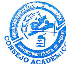
HORARIO DE TRABAJO DEL PERSONAL ACADEMICO