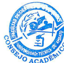
HORARIO DE TRABAJO DEL PERSONAL ACADEMICO