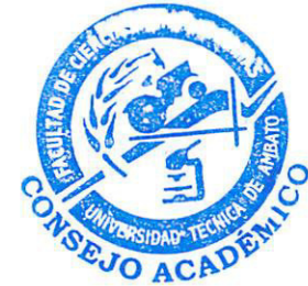
HORARIO DE TRABAJO DEL PERSONAL ACADEMICO